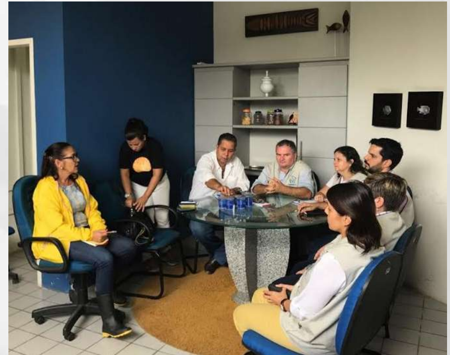
Equipe do Escritório Local em Rio Formoso