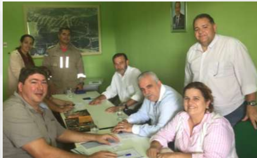
Equipe em Barra de Guabiraba