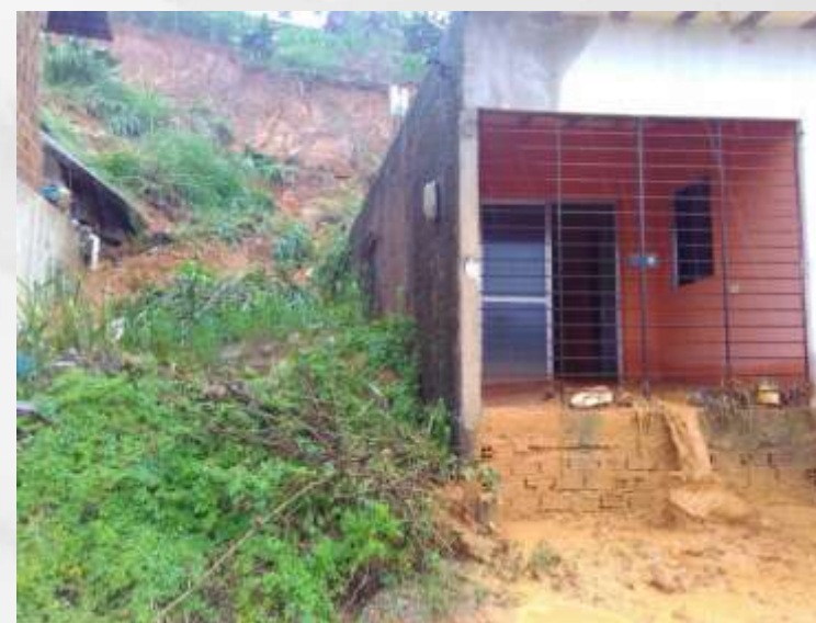
Situação encontrada pela equipe em Sirinhaém